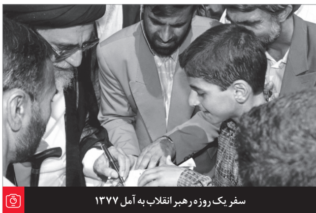
سفر یک روزه رهبر انقلاب به آمل ۱۳۷۷

همه قانون را معیار بدانند؛ ما از بی قانونی ضرر می‌کنیم، ضربه می‌خوریم. سال ۸۸ دیدید؛ اینکه کشور در سال ۸۸ دچار خسارت شد - سال ۸۸، هم خسارت مادی پیدا کردیم، هم آبرویمان در دنیا به خطر افتاد - به خاطر چه بود؟ به خاطر بی قانونی. به اینها گفتیم بیا باید طبق قانون عمل کنیم؛ قانون مشخص است. شما می‌گویید انتخابات ایراد دارد؛ خیلی خوب، آنجایی که انتخابات ایراد دارد، تکلیف قانونی واضح است که چه جوری باید حل کرد قضیه را؛ خوب بیا باید طبق آن عمل کنیم. نکردند، زیر بار قانون نرفتند، بی قانونی کردند، خوب مشکل درست کردند؛ برای کشور مشکل درست کردند، برای خودشان مشکل درست کردند؛ هفت هشت ماه همین‌طور پشت سر هم ناامنی و مشکلات گوناگون درست کردند. این به خاطر نرفتن زیر بار قانون است. ۹۶/۱۰/۱۹