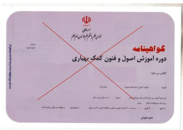
مدرک غیر قابل قبول

مدرک کمک بهیاری در این فراخوان مورد قبول نمی باشد.